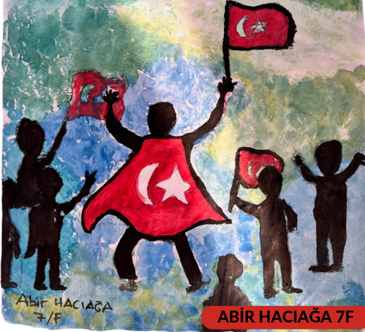
ABİR HACIĞA 7F

15 Temmuz Milli Birlik Ve Demokrasi Günü