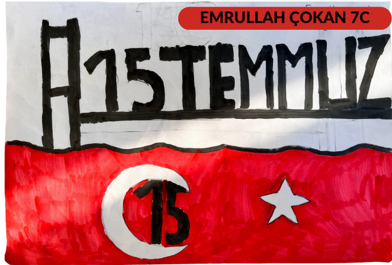
EMRULLAH ÇOKAN 7C