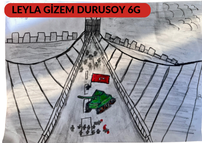
LEYLA GİZEM DURUSOY 6G