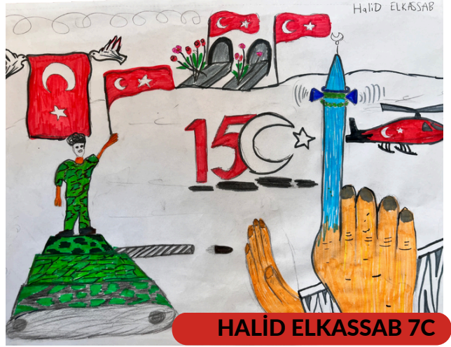
HALİD ELKASSAB 7C